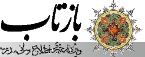
ویژه‌نگار اطلاع‌رسانی در زمینهٔ علمای اهل‌بیت