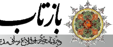
ویژه‌نگار اطلاع‌رسانی در زمینهٔ علمای اهل‌بیت